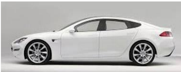
Tesla model S

In 2013 kwam in Europa een volledig elektrische 5-persoons auto op de markt, de Tesla model S Enkele gegevens: