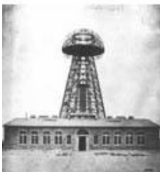
De Warden Clyff Tower

Experimenten hiermee vonden echter nooit plaats, omdat zijn geldschieters het lieten afweten. Die zagen helemaal niets in gratis energie.