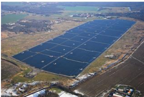
Waldpolenz Solar Park