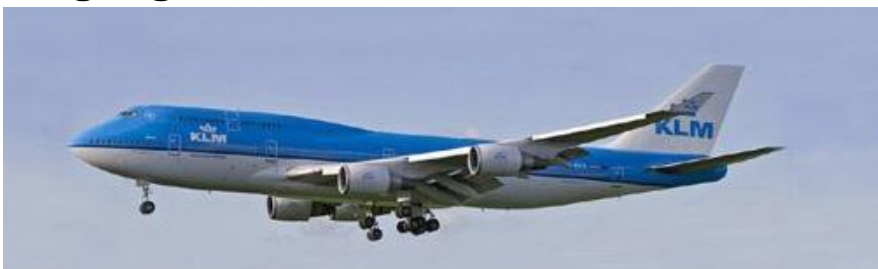
Boeing 747 "Jumbo"