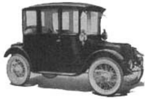
Een elektrische auto uit 1916

Al in de jaren 1899 -1915 werden er in Amerika 5000 elektrische auto's gefabriceerd door Baker Electric. De topsnelheid was 23 kilometer per uur, bij een actieradius van 80 kilometer. Een ander bekend merk uit die begintijd was Detroit Electric. Deze firma produceerde elektrische auto's die een topsnelheid bereikten van 32 kilometer per uur, bij een actieradius van 130 kilometer.