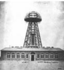
De Warden Clyff Tower

Zijn grootste uitvinding zou zijn, de wereldwijde energievoorziening door "vrije energie", afgetapt uit de "ether". ("vrije energie" is de letterlijke vertaling van "free energy" = gratis energie). Experimenten hiermee vonden echter nooit plaats, omdat zijn geldschieters het lieten afweten. Die zagen helemaal niets in gratis energie.